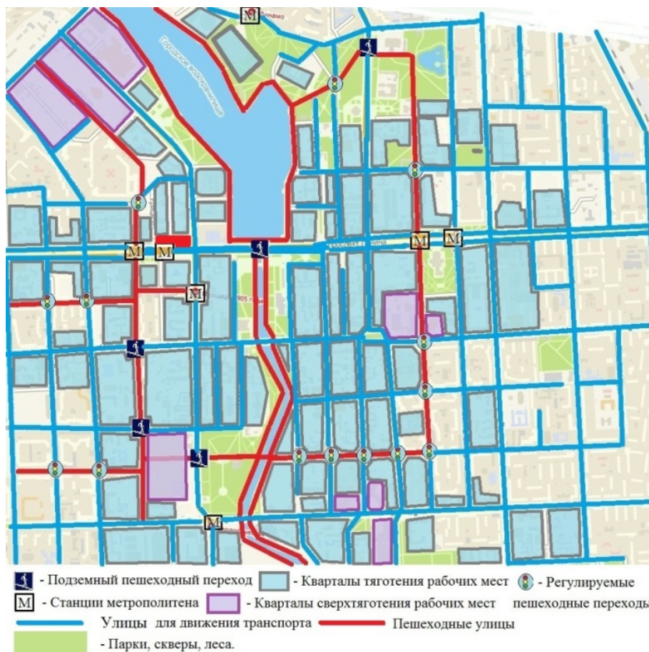
Рис. 3. Предлагаемая схема организации пешеходных улиц в центре Екатеринбурга

В покрытии из брусчатки можно делать разметку из камней, срок службы которых исчисляется десятилетиями. Обычная краска или термопластик не выдерживают больше 6 месяцев. Кроме того срок службы покрытия из брусчатки в десятки раз дольше, а межремонтный срок – в несколько раз больше, чем у качественного покрытия из асфальтобетона.